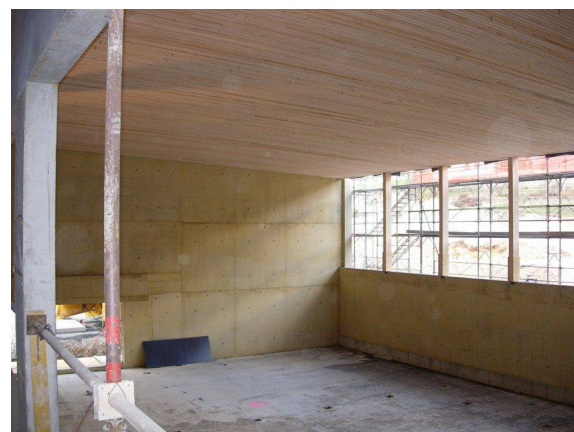
Toiture bois de la salle de gymnastique.