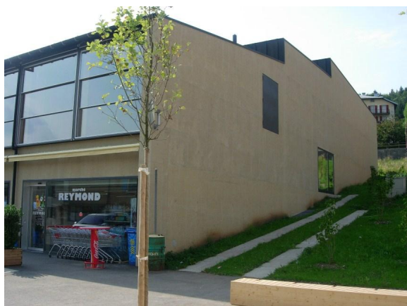
Vue d'une façade.