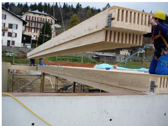
Pose de la charpente bois préfabriquée.